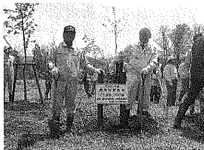
今年は、国際森林年という事で、記念プレートのほかに記念標柱も建てました。