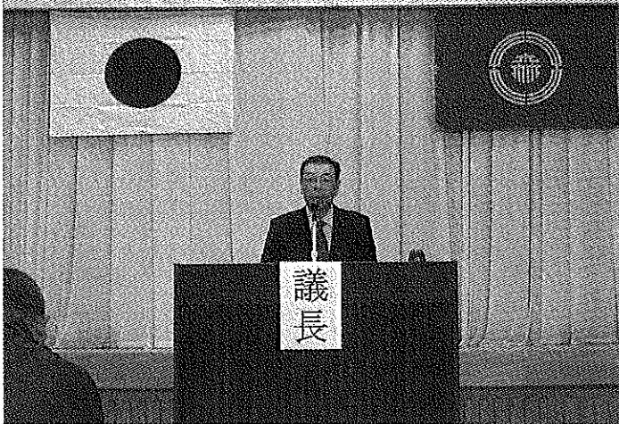
第42回鹿角森林組合通常総代会