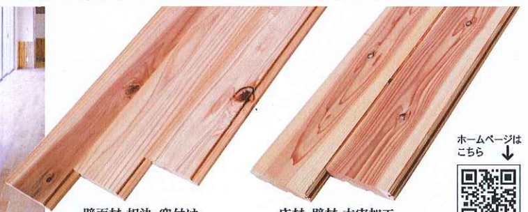
壁面材 相決・突付け