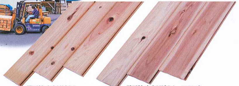
壁面材 本実目透かし