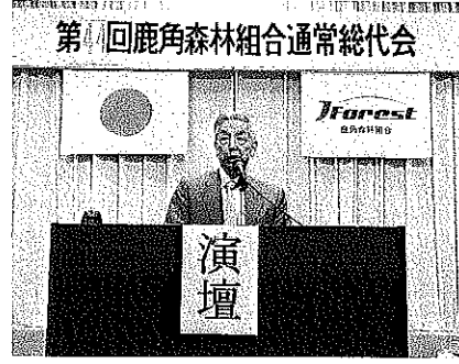
第44回鹿角森林組合通常総代会

第四十四回通常総代会の開催に当たり、総代の皆様には農繁期の中、御出席いただき有難うございます。